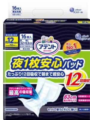
アテント 夜1枚安心パッド たっぷり12回吸収で朝まで超安心 12回吸収16枚

エリエールブランドの大王製紙株式会社(住所:東京都千代田区富士見二丁目10番2号)は、アテント尿とりパッド史上 最高の吸収量(当社調べ 平成29年5月時点)の『アテント夜1枚安心パッド たっぷり12回吸収で朝まで超安心』を平成29年10月21日より新発売します。