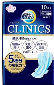
量が心配な人用 40cm 羽つき(10 枚入)

エリエールブランドの大王製紙株式会社(住所:東京都千代田区富士見二丁目 10 番 2 号)は、過多月経の経血トラブルに着目した専用設計の生理用ナプキン「elis(エリス) クリニクス」を、店頭で購入しやすい 6 枚入りを新たに加え、「朝まで超安心」シリーズとして平成 28 年 9 月 21 日よりリニューアル・新発売します。