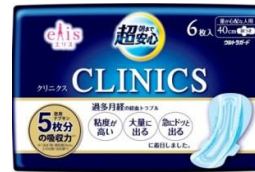
量が心配な人用 40cm 羽つき(6 枚入)