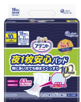
アテント 夜 1 枚安心パッド 特に多い方でも朝までぐっすり 10 回吸収 18 枚

※イメージ SRI 調べ大人用おむつ尿とりパッド (パンツ用パッドを除く) 市場 2015 年 4 月~2016 年 3 月 累計販売金額 NO.1 ブランド (アテント夜用パッドシリーズ 合計)