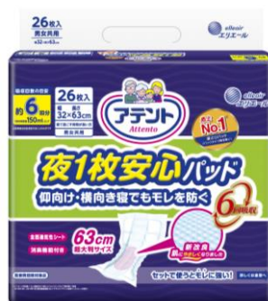
アテント 夜 1 枚安心パッド 仰向け・横向き寝でもモレを防ぐ 6 回吸収 26 枚