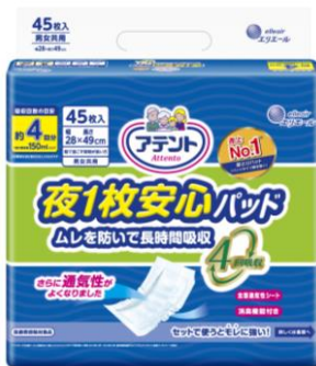
アテント 夜 1 枚安心パッド ムレを防いで長時間吸収 4 回吸収 45 枚

エリエールブランドの大王製紙株式会社(住所:東京都千代田区富士見二丁目 10 番 2 号)は、夜用パッドに求められる基本機能の「モレにくさ」に「肌のやさしさ」をプラスした『アテント夜 1 枚安心パッド』を平成 28 年 9 月 21 日よりリニューアルします。