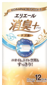
エリエール消臭+(プラス) トイレットティッシュ12R