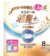
エリエール消臭+(プラス) トイレットティッシュコンパクト8R