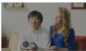
バカリズムさん 「やっぱり、エリエールの」