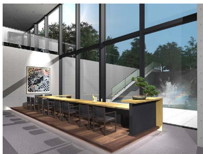
滝と噴水を臨むダイニング