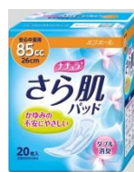
安心中量用 85 cc 26 cm