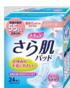
快適中量用 55 cc 24 cm