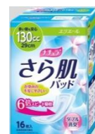
多い時も安心 130 cc 29 cm