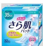
安心少量用 35 cc 20.5 cm

エリエールブランドの大王製紙株式会社(住所:東京都中央区八重洲 2-7-2 八重洲三井ビル)は、軽い尿もれ用のケア商品『ナチュラ快滴さらり安心パッド』を『ナチュラさら肌パッド』として全面リニューアル発売いたします。腹圧性失禁(お腹に力が入った時に出る)、切迫性失禁(急に我慢できなくなって出る)の各症状別のニーズに対応する商品とします。