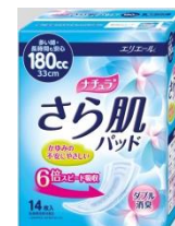
多い時・ 長時間も安心 180 cc 33 cm