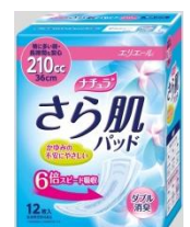
特に多い時・ 長時間も安心 210 cc 36 cm