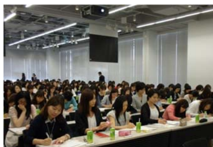
【女性活躍推進全体会議の様子】

ダイバーシティ推進の主旨・意義を経営トップから発信し全社に周知するため、6 月～7 月にかけて 全国 3 ヶ所にて、女性社員、社長ほか役員、女性社員を部下に持つ管理職を集め「女性活躍推進全体会議」を開催しました。引き続き、活躍支援につながる諸施策を、スピードを上げて実行して参ります。