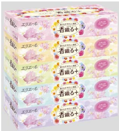
エリエール香織る+140組 5個パック

エリエールブランドの大王製紙株式会社(住所:東京都中央区八重洲2-7-2 八重洲三井ビル)では、香りつきティッシュの『エリエール香織る+(かおるプラス)ティッシュ』を様々な生活シーンで、家族みんなで普段使いできるティッシュに2014年4月21日よりリニューアル発売します。