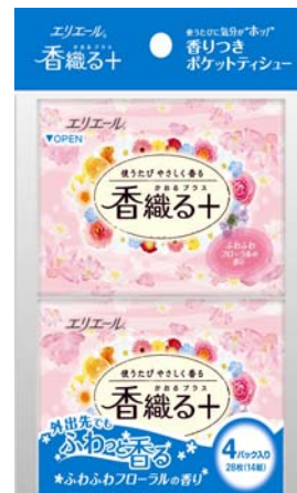
エリエール香織る+ポケット14組4個パック