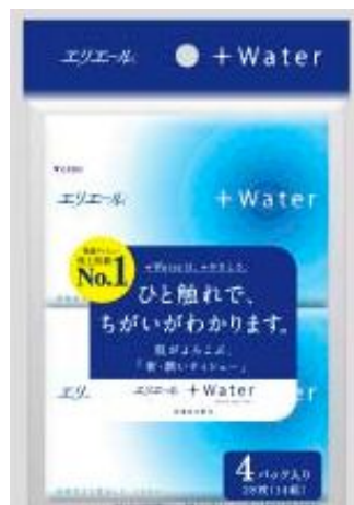
エリエール+Water 14組4個パック ポケットタイプ