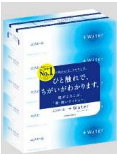
エリエール+Water 180組5個パック ボックスタイプ

エリエールブランドの大王製紙株式会社(住所:東京都新宿区早稲田町70番1号)では、2010年に発売を開始し、高い評価をいただいております『エリエール+Water(プラスウォーター)』の品質をあらたにリニューアル発売いたします。