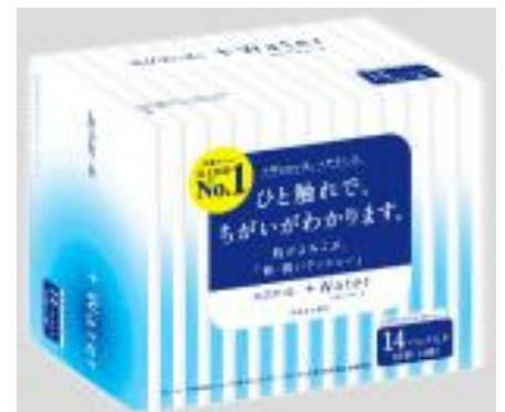
エリエール+Water 14組14個パック ポケットタイプ