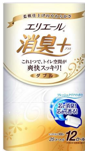
エリエール消臭+(プラス)トイレトティッシュ12R(ダブル)

エリエールブランドの大王製紙株式会社(住所:東京都新宿区早稲田町70番1号)では、「トイレの嫌な臭いを取り除きたい」という生活者ニーズの高まりを受け、「エリエール消臭+(プラス)トイレトティッシュ12R(ダブル)」を2013年3月21日(木)より全国発売いたします。