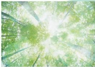
グリーン・ナチュラル系