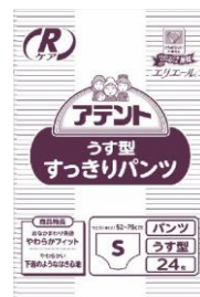
アテント Rケアうす型すっきりパンツ(業務用)