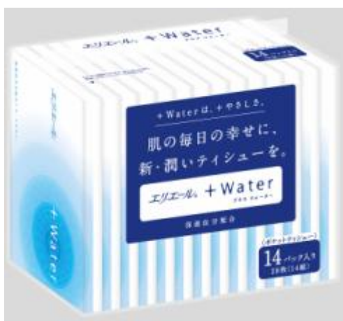
エリエール +Water ポケット 14W 組 14個入り

エリエールブランドの大王製紙株式会社(住所:東京都新宿区早稲田町 70番1号)では、「エリエール +Water ポケット 14組 14個入り」を2011年9月21日(水)より全国発売いたします。