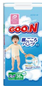
Bigサイズ(男の子/女の子)