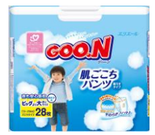
Bigより大きいサイズ(男の子/女の子)