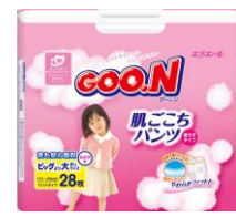
Bigより大きいサイズ(男の子/女の子)