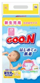
新生児用小さめサイズ