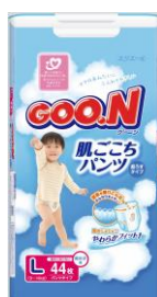
Lサイズ(男の子/女の子)