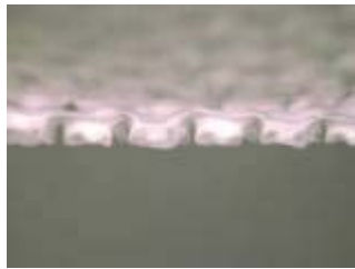
メッシュシート断面

生理用ナプキンの技術を応用し、ペットシートの表面に3Dドライメッシュシートを採用しました。フィルム状の単一シートに設けた漏斗状の開孔により、一旦吸収したおしっこが表面に戻りにくい ため、不快な足ヌレを低減できます。