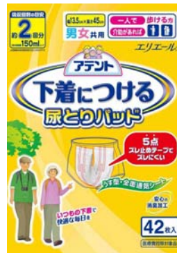
アテント 下着につける尿とりパッド

エリエールブランドの大王製紙株式会社(住所:東京都新宿区早稲田町 70 番 1 号)では、普段の下着との併用を前提とし、優れた通気性を備え、動いてもズレにくいパッド「アテント 下着につける尿とりパッド」を2010年3月21日(日)より全国発売します。