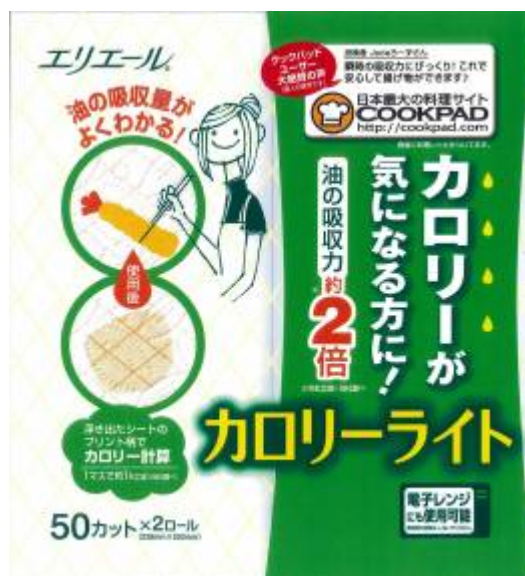
(パッケージ正面デザイン)

エリエールブランドの大王製紙株式会社(住所:東京都新宿区早稲田町 70 番 1 号)では、 「エリエール カロリーライト」を2009年9月21日(月)よりリニューアル発売いたします。