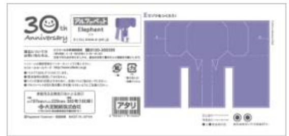
(ティッシュ底面画像※最下段)