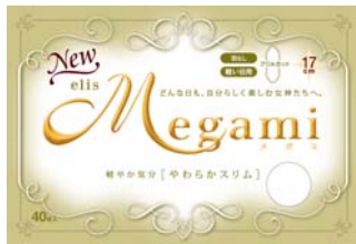
elis Megami やわらかスリム 軽い日用

エリエールブランドの大王製紙株式会社(住所:東京都新宿区早稲田町70番1号)では、「elis(エリス)Megami やわらかスリム」シリーズに軽い日用、夜用の新シリーズとして「elis(エリス)Megami リラックスナイト」シリーズを追加し特に多い日の夜用を、2009年3月21日(土)より全国発売し、生理期間を通して「elis(エリス)Megami」で過ごせるラインアップに拡充します。