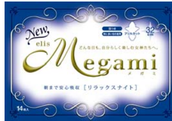
elis Megami リラックスナイト 特に多い日の夜用