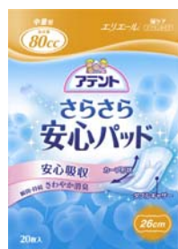
安心の中量用 26 cm, 80 cc 20枚