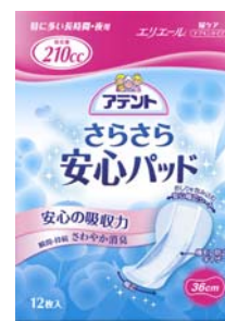
安心の特に多い長時間・夜用 36 cm, 210 cc 12枚