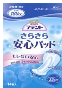
安心の長時間・夜用 32 cm, 180 cc 14枚