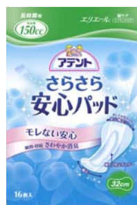
安心の長時間用 32 cm, 150 cc 16枚