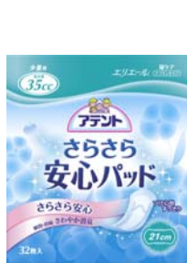
安心の少量用 21 cm, 35 cc 32枚