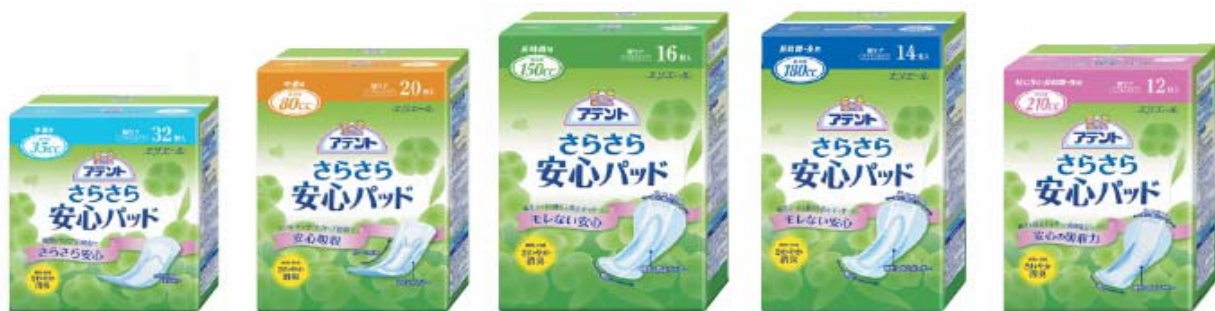
アテント さらさら安心パッド

エリエールブランドの大王製紙株式会社(住所:東京都新宿区早稲田町70番1号)では、軽い尿もれ用パッド「アテントさらさら安心パッド」シリーズを、2008年3月21日(金)より全国発売します。