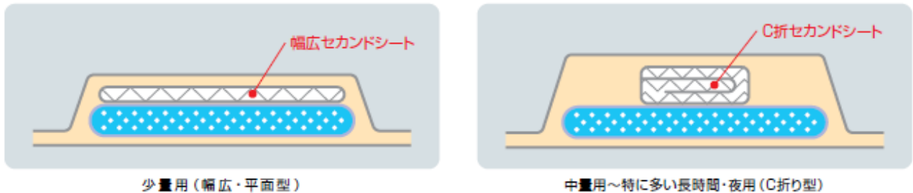
製品断面イメージ図

「中量用～特に多い長時間・夜用」はC折りセカンドシート採用で、どっと出た尿を吸収体へ引き込みます。心配なあふれモレを防止し、素早くサラッとします。