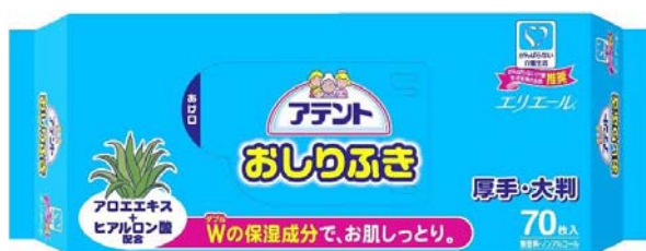
アテントおしりふき70枚

エリエールブランドの大王製紙株式会社(住所:東京都新宿区早稲田町70番1号)では、介護する側にも、される側にもやさしいケアの考え方“がんばらない介護生活”のコンセプトに沿い「アテントおしりふき」「アテントからだふき」を2008年3月21日(金)より全国発売いたします。