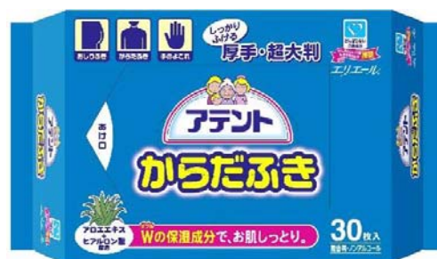
アテントからだふき30枚