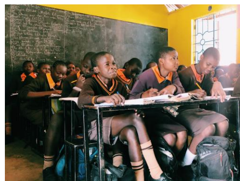
マゴソスクールで勉強する様子