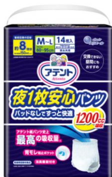
アテント 夜1枚安心パンツ パッドなしでずっと快適 M～L 男女共用 14枚

大王製紙株式会社（住所：東京都千代田区）は、パンツ 1枚でモレない安心感と快適なはき心地を追求した「アテント夜 1枚安心パンツ パッドなしでずっと快適」を 2018年10月21日（日）より新発売します。