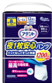
アテント 夜1枚安心パンツ パッドなしでずっと快適 L～LL 男女共用 12枚