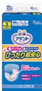
アテント 紙パンツ用尿とりパッド ぴったり超安心 2回吸収 48枚

大王製紙株式会社（住所：東京都千代田区）は、従来の「アテント紙パンツにつける尿とりパッド」を吸収回数毎のユーザーのニーズに対応した、「アテント紙パンツ用尿とりパッド ぴったり超安心」シリーズへ2018年9月21日（金）よりリニューアル発売します。