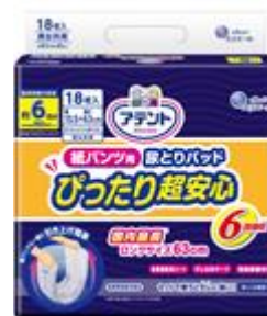
アテント 紙パンツ用尿とりパッド ぴったり超安心 6回吸収 18枚