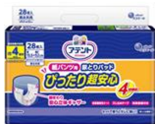
アテント 紙パンツ用尿とりパッド ぴったり超安心 4回吸収 28枚