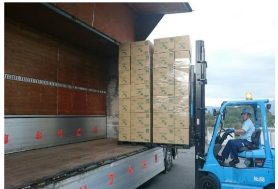
(パレット輸送：機械荷役)

ELC4 棟の運用とパレット輸送の組合せにより、荷役作業の効率化を進めるとともに、人手不足の要因である敬遠される作業を軽減することで、トラック乗務員にとって働きやすい環境を整え、幅広い人材に活躍頂ける物流現場を実現します。