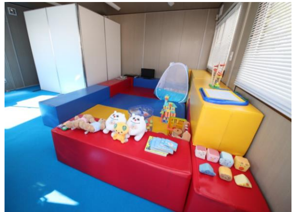
グーンハウス ※画像は過去大会のイメージです。