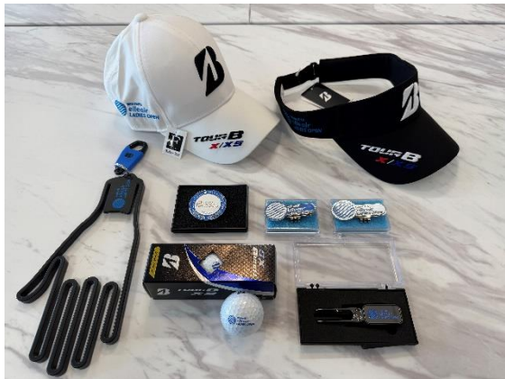
大会オリジナルグッズ一例 ※画像はイメージです。