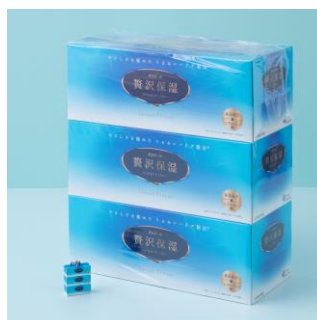
「エリエール 贅沢保湿ティシュー」 実商品との比較