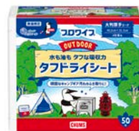
プロワイフ タフドライシート 50 枚