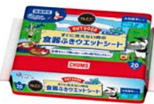
キレイ！ 食器ふきウエットシート 20 枚