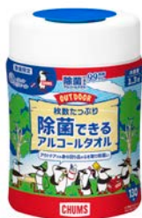
枚数たっぷり 除菌できるアルコールタオル 本体 130 枚／つめかえ用 110 枚

衛生用紙製品 No.1 ブランド ※1 の「エリエール」を展開する大王製紙株式会社（本社：東京都千代田区）は、アウトドア・カジュアルブランド「CHUMS（チャムス）」とコラボレーションしたエリエール初のアウトドア専用シリーズとして、共同開発 4 商品およびデザインコラボ 1 商品のエリエール×チャムス「コラボプロジェクト企画品」を 2024 年 4 月 1 日（月）から数量限定で全国発売します。