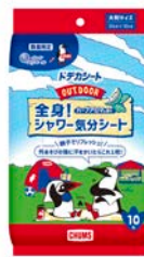
ドデカシート 全身シャワー気分シート 10 枚