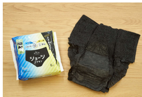
エリスショーツL～LLサイズ（2個入／4個入）