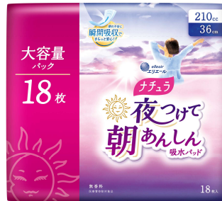
ナチュラ 夜つけて朝あんしん 吸水パッド 210cc 大容量 18枚

衛生用紙製品 No.1 ブランド ※1 の「エリエール」を展開する大王製紙株式会社（本社：東京都千代田区）は、夜用吸水ケア用品「ナチュラ 夜つけて朝あんしん 吸水パッド」シリーズから、最も吸収量が多い 210cc の大容量タイプ『ナチュラ 夜つけて朝あんしん 吸水パッド 210cc 大容量 18枚』を2024年4月22日（月）から全国発売します。