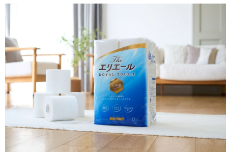
The エリエール トイレトティシュー 12ロール（ダブル）