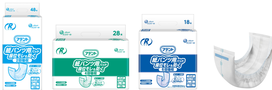
アテント R ケア 紙パンツ用パッド座位モレも防ぐ（2 回吸収／4 回吸収／6 回吸収）

衛生用紙製品 No.1 ブランド ※1 の「エリエール」を展開する大王製紙株式会社（本社：東京都千代田区）は、“座位モレ”に着目した「アテント R ケア 紙パンツ用パッド座位モレも防ぐ」（2 回吸収／4 回吸収／6 回吸収）を 2024 年 3 月 21 日（木）から全国の病院・介護施設等向けに発売します。