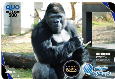
「シャバーニ」デザイン QUO カード 500 円分

【賞 品】 シャバーニデザイン QUO カード（キャンペーン 1 回につき 101 名さま、合計 303 名さま） ・①②のどちらも行っていた方の中から抽選で各回 100 名さまに QUO カード 500 円分 ・①②③の全てを行っていた方の中から各回 1 名さまに QUO カード 1 万円分