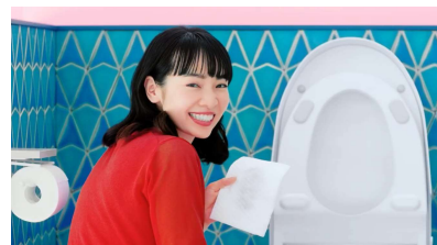
「キレイラ！トイレクリーナー」TV CM

YouTubeURL : https://youtu.be/8jAmeNPUUwY