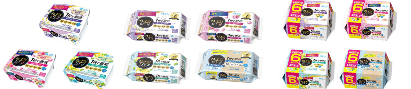
キレキラ！トイレクリーナー 1 枚で徹底おそうじシート 本体 （クリーンフローラル・ハッピーローズ・シトラスミント）

MAIL： https://www.elleair.jp/inquiry/rules