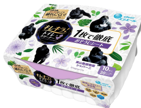
『キレイラ！トイレクリーナー 1 枚で徹底おそうじシート クリーンフローラル本体』 「シャバーニ」コラボパッケージ

【賞 品】 シャバーニの 27 歳の誕生日を記念して、①②のどちらも行っていた方の中から抽選で、27 名さまに『キレイラ！トイレクリーナー 1 枚で徹底おそうじシート クリーンフローラル本体』のシャバーニコラボパッケージ