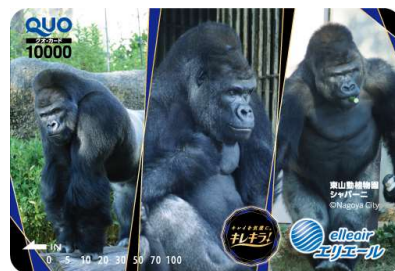
「シャバーニ」デザイン QUO カード 1 万円分