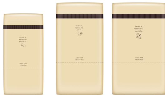
「ナチュラ さら肌さらり コットン 100% シンプルデザイン」