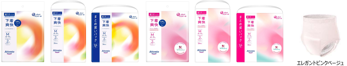
エレガントピンクベージュ