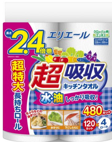
エリエール 超吸収キッチンタオル 4ロール（120カット） 2.4倍巻

衛生用紙製品 No.1 ブランド ※1 の「エリエール」を展開する大王製紙株式会社（本社：東京都千代田区）は、長く巻いても潰れにくい当社独自開発のエンボス（凹凸）加工で、油をキープしてしっかり吸収する『エリエール 超吸収キッチンタオル 4ロール（120カット） 2.4倍巻』を2023年4月21日（金）から北海道を除く全国で発売します。