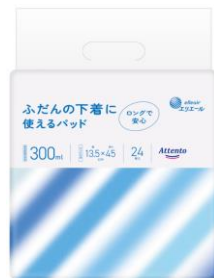
アテント ふだんの下着に使えるパッド

衛生用紙製品 No.1 ブランド ※1 の「エリエール」を展開する大王製紙株式会社（本社：東京都千代田区）は、安心の300ml吸収量とシンプルなパッケージデザインを採用した下着用の尿とりパッド『アテント ふだんの下着に使えるパッド』を2023年4月21日（金）から全国で発売します。