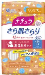
ナチュラ さら肌さらり 軽やか吸水パンティライナー 17cm3cc

衛生用紙製品 No.1 ブランド ※1 の「エリエール」を展開する大王製紙株式会社（本社：東京都千代田区）は、吸水ケアブランド「ナチュラ」から、安心感のある長さで初めての方でも使いやすい「さら肌さらり 軽やか吸水パンティライナー」シリーズ2種（17cm3cc／コットン100% ※2 17cm3cc）および「さら肌さらり よれスッキリ」シリーズの吸水パッド2種（24cm30cc／26cm50cc）を2023年4月21日（金）から全国発売します。