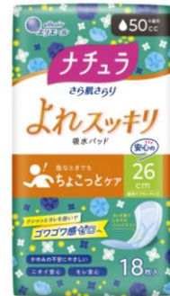
ナチュラ さら肌さらり よれスッキリ吸水パッド 26cm50cc