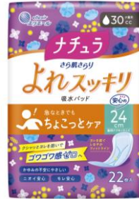
ナチュラ さら肌さらり よれスッキリ吸水パッド 24cm30cc