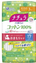
ナチュラ さら肌さらり コットン100% 軽やか吸水パンティライナー 17cm3cc