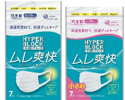
7枚入（ふつう／小さめサイズ）

【公式HP】 https://www.elleair.jp/hyper-block/point/