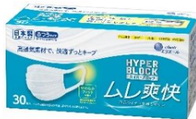
30枚入（ふつろ/小さめサイズ）