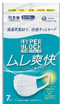
7枚入（ふつろ/小さめサイズ）

衛生用紙製品 No.1 ブランド ※1 「エリエール」を展開する大王製紙株式会社（本社：東京都千代田区）は、マスク装着時のムレを軽減する高機能不織布マスク『ハイパーブロックマスク ムレ爽快』の耳掛け素材のやわらかさをアップするとともに、パッケージも刷新し、2023年4月1日（土）から全国でリニューアル発売します。