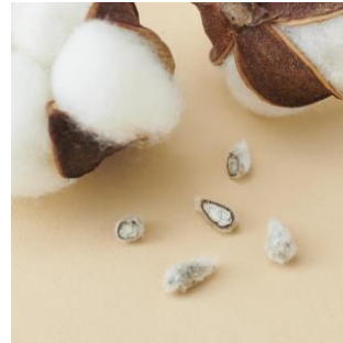
コットンリントー