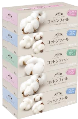
エリエール コットンフィールティシュー 150組5箱パック

衛生用紙製品 No.1 ブランド ※2 の「エリエール」を展開する大王製紙株式会社（本社：東京都千代田区）は、コットン配合の天然素材 100%ティシュー「エリエール コットンフィールティシュー」の柔軟剤配合技術を向上させることで、ふんわり感とやわらかさをアップし、2023年3月21日（火・祝）から全国でリニューアル発売します。