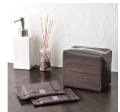
エリス 素肌のきもち シンプルデザイン (2019年発売)

そこで、吸水ケア品への抵抗感を和らげ、より身近に感じていただくことをめざし、女性の悩みに寄り添う吸水ケアブランド「ナチュラ」から、暮らしになじむ落ち着いたデザインの「ナチュラ さら肌さらり コットン100% シンプルデザイン」3種を EC サイトで先行発売。“吸水ケア品らしくない”ナチュラルなパッケージとシックなブラウンの個包装デザインで、吸水ケア品に“シンプル”という新たな選択肢を提案してまいります。