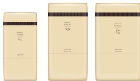
「ナチュラ さら肌さらり コットン 100% シンプルデザイン」