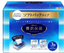
ソフトパック 130組 3個パック