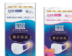
(ふつう/小さいサイズ)

【公式 HP】 https://www.elleair.jp/product/detail/mask_zeitaku