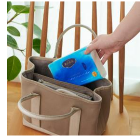
エリエール 贅沢保湿ソフトパックティッシュ／130組3個パック