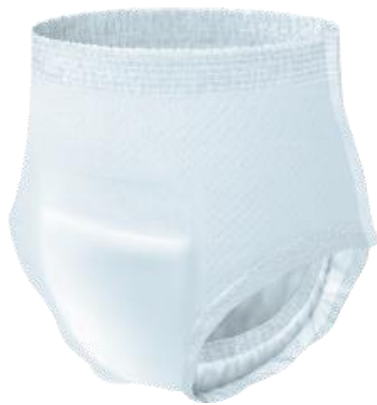
シンプルホワイト

【公式HP】 https://www.elleair.jp/product/detail/care_pants_outer_underwear_refresh_plus_m