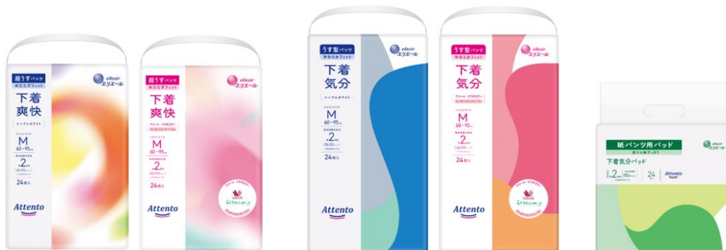
「アテント 下着爽快」 左：シンプルホワイト 右：エレガントピンクベージュ

ユーザーの皆さまからのご意見をさらに発展させて、このたび、超うすタイプ紙パンツ「アテント 下着爽快」、うす型タイプ紙パンツ「アテント 下着気分」、紙パンツ用パッド「アテント 下着気分パッド」を発売しました。