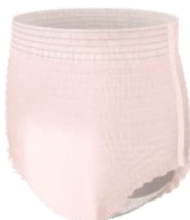
エレガントピンクベージュ