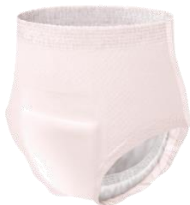
エレガントピンクベージュ