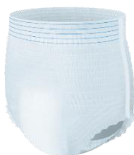
シンプルホワイト

下着気分パッド https://www.elleair.jp/product/detail/shitagikibun_pad