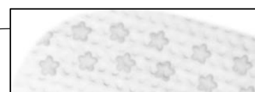
※「さくらの花」モチーフ拡大図