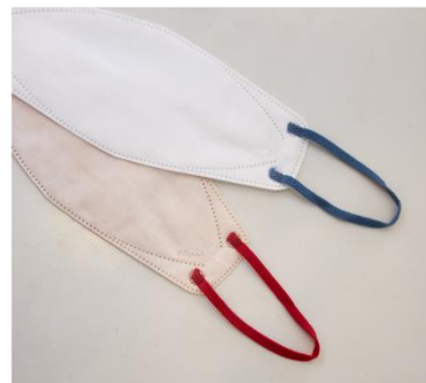
『エリエール ハイパーブロックマスク かお・スマ 6枚入』 ピンクベージュ×茜(あかね) / ホワイト×碧(あお)