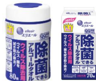
(除菌できるアルコールタオル ウイルス除去用)