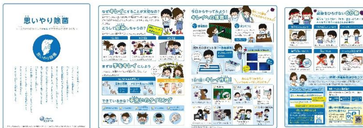
(小学校配布用 冊子)

衛生用紙製品 No.1 ブランド ※1 の「エリエール」を展開する大王製紙株式会社（本社：東京都千代田区）は、「思いやり除菌」プロジェクトを2022年3月から始動いたします。「思いやり除菌」とは、自分のためだけでなく、大切な誰かを思い、正しく除菌をすることによって、誰もが安心して触れ合うことができる学校・社会を目指す活動です。「思いやり除菌」が未来の当たり前の習慣となることで、社会を菌やウイルスから守ることにつながると考えます。まずは、未来を担う子どもたちのために、小学校での除菌教育をお手伝いする活動を開始します。