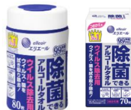
除菌できるアルコールタオル ウィルス除去用

【「思いやり除菌」プロジェクト公式 HP】 https://www.elleair.jp/omoiyari-jokin