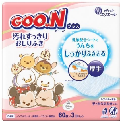
パッケージデザインイメージ

衛生用紙製品 No.1 ブランド ※1 の「エリエール」を展開する大王製紙株式会社（本社：東京都千代田区）は、乳液成分を配合した厚手のぼこぼこシートで汚れ落ちを向上させた新商品『グーンプラス 汚れすっきりおしりふき』を2022年3月22日（火）から全国で発売します。