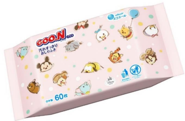
内装デザインイメージ