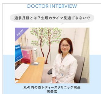
過多月経の原因や対処法を産婦人科の専門医にインタビュー