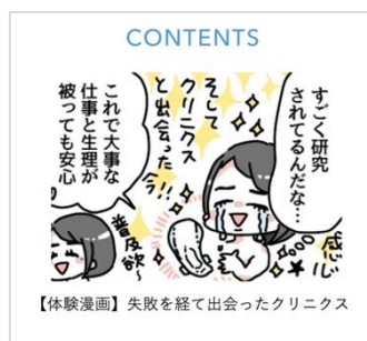
過多月経や「エリス 朝まで超安心 クリニクス」の特徴を漫画で紹介