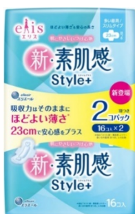
エリス 新・素肌感 Style+