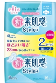
『エリス 新・素肌感 Style+』 (新発売)