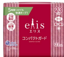
「エリス コンパクトガード」 (リニューアル)