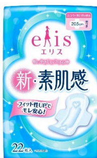
エリス 新・素肌感