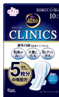
エリス 朝まで超安心 クリニクス(CLINICS)