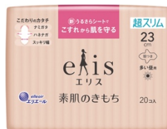
「エリス 素肌のきもち」 (リニューアル)