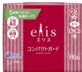
エリス コンパクトガード