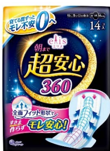
エリス 朝まで超安心