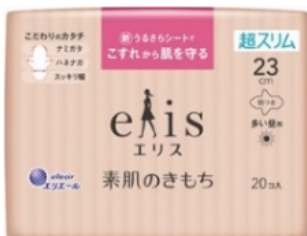
エリス 素肌のきもち