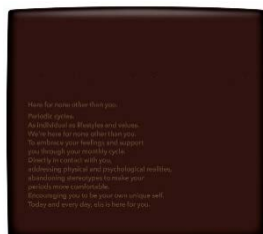
エリス 素肌のきもち 超スリム シンプルデザイン